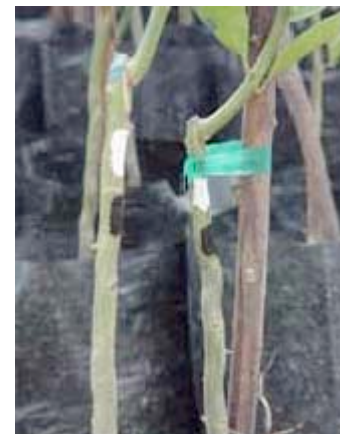
Injerto de cítricos

Una de las industrias que recurren con mayor frecuencia a esta técnica es la vitivinicultura o cultivo de la vid para mejorar la producción de viñedos. Con gran frecuencia las plantas productoras de uvas de baja calidad, pero muy resistentes a la sequía y a las enfermedades, son injertadas con segmentos de vides de alta producción y calidad.